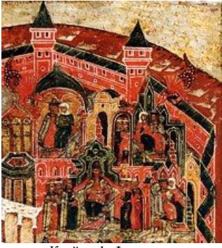
Клеймо 1. Фрагмент.

В нем самодержествовал благоверный князь именем Павел. Искони ненавидящий добро в роде человеческого дьявол велел неприязненному змею летать к жене князя того на блуд. И являлся он ей своим наваждением в своем естественном облике, приходящим же людям казалось, будто это сам князь сидит с женой своей. В таком наваждении немало времени прошло. Жена же этого не таила и рассказала князю, мужу своему, о всем приключившимся с ней. Змей же зловерный насилие творил над нею.