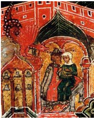
Клеймо 1. Фрагмент.

Князь думал, что ему сделать со змеем, и не мог придумать. И сказал жене: «Думаю, жена, и недоумеваю, что мне сделать со злым тем? Не ведаю, какой бы смерти предать его. Когда он будет говорить с тобой, то исхитрись спросить об этом: знает ли этот злодей духом своим, что ему смертью угрожает? Если что узнаешь и нам поведаешь, то освободишься не только в нынешнем веке от злого его дыхания, и шипения, и гнусности, о чем мерзко и говорить, но и в будущей жизни нелицемерного судью Христа умилоставишь». Жена же слова мужа своего в сердце