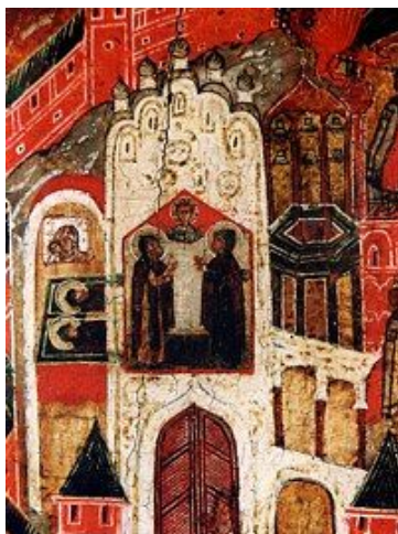
Клеймо 1. Фрагмент.

Мы же, по силе нашей, приложим хваление им.